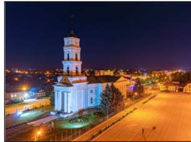
Foto: Dreifaltigkeitskirche Marx/Wolga