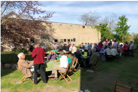
Fröhliches Kaffeetrinken mit wunderbarem Kuchenbuffet