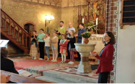
Kinderchor Bornstedt und Tenöre

Unter dem Motto "Lasst uns miteinander singen, loben, danken dem Herrn" feierten am Sonntag Kantate über 60 Sängerinnen und Sänger sowie sechs Kinder des Kinderchores Bornstedt in der Kirche Bornim das Chorfest der Nordregion. In fröhlicher Atmosphäre wurde geprobt, gelacht, gegessen und natürlich viel gesungen. Jeder Chor