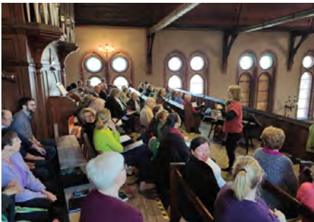
Probe auf der Orgelempore